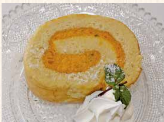
かぼっちゃロールケーキ 350円