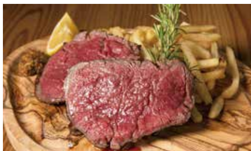
炭火焼黒毛和牛ヒレステーキ (200g) 6,000円