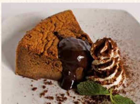
生チョコシフォン 450円