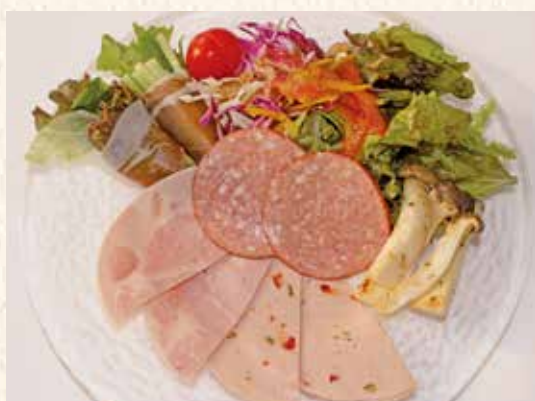
気まぐれソーセージサラダ 900円