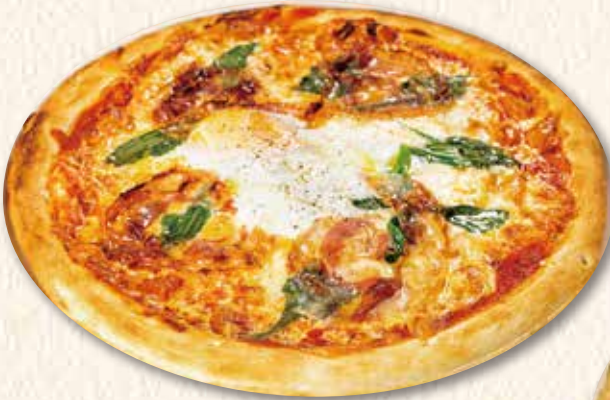
ビスマルクピザ 1,500円