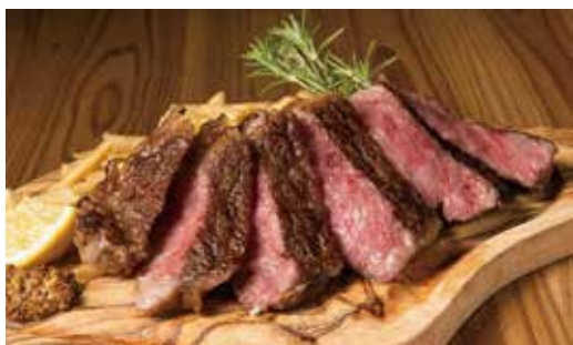
炭火焼黒毛和牛サーロインステーキ (200g) 5,000円