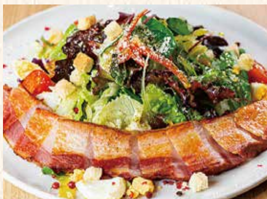
黒豚ベーコンのシーザーサラダ 弁当 1,100円 1,200円