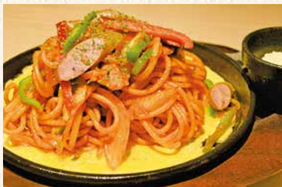
彩り野菜のナポレターナ