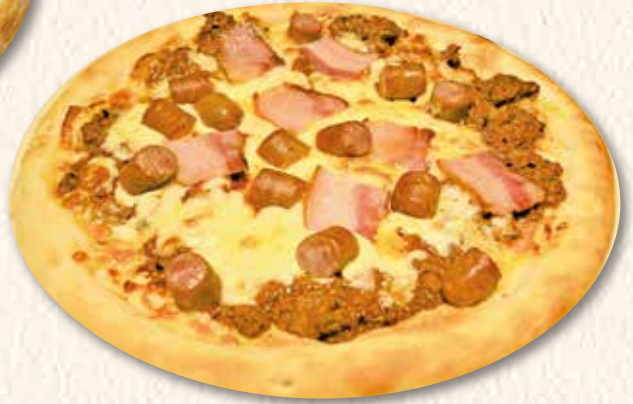
黒豚肉・肉・肉のピザ 1,600円