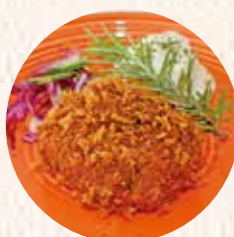
南州農場メンチカツ(1個) 300円 ジューシー春巻き 200円