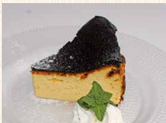
バスクチーズケーキ 400円