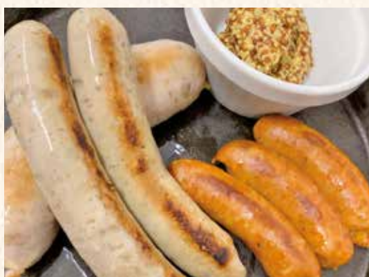
マイスターのおすすめソーセージの 盛り合わせ 1,200円