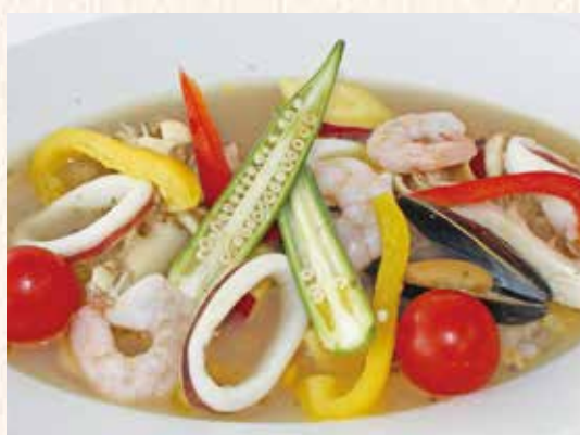
魚介と季節野菜の白ワイン蒸し 1,000円