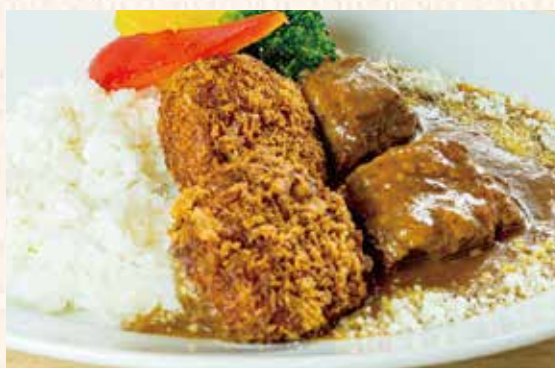
黒豚メンチカツカレー