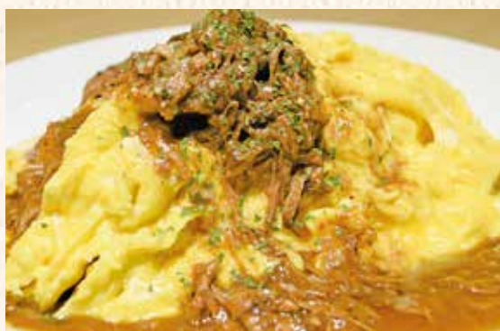
とろとろオムライスの黒豚赤ワインソース