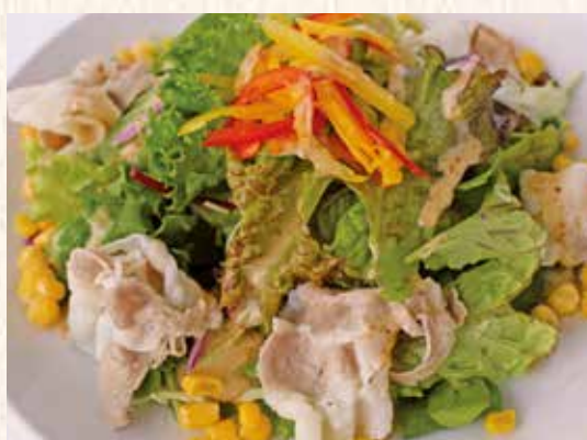
黒豚とミックス野菜の冷しゃぶサラダ 850円