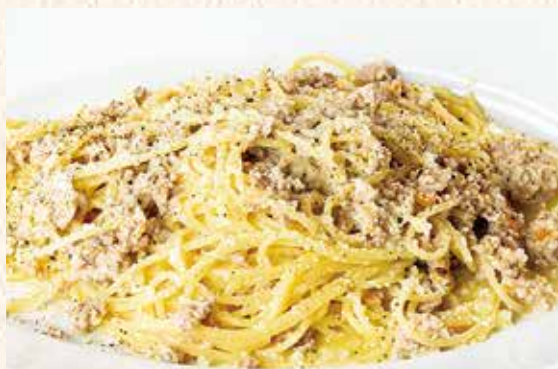
黒豚の白いボロネーズスパゲティー