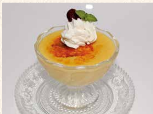
カスタードプリン 250円