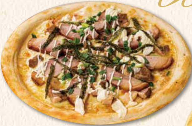
黒豚テリヤキピザ 1,600円