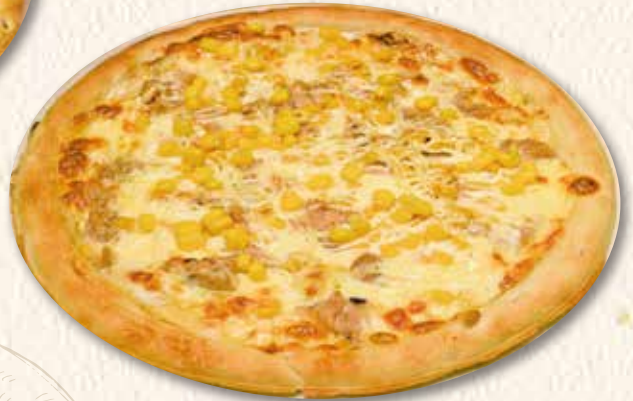
ツナコーンマヨピザ 1,400円