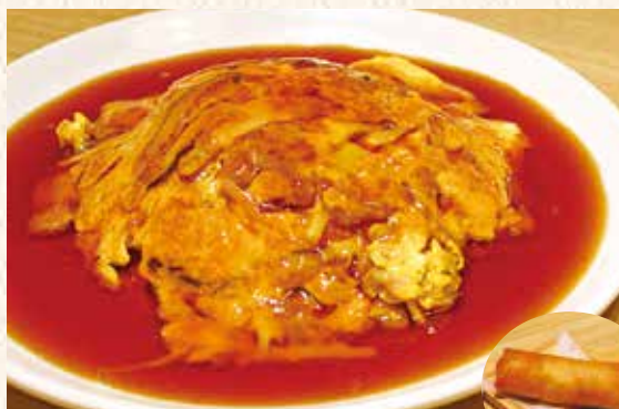
バラの香りの黒豚天津飯