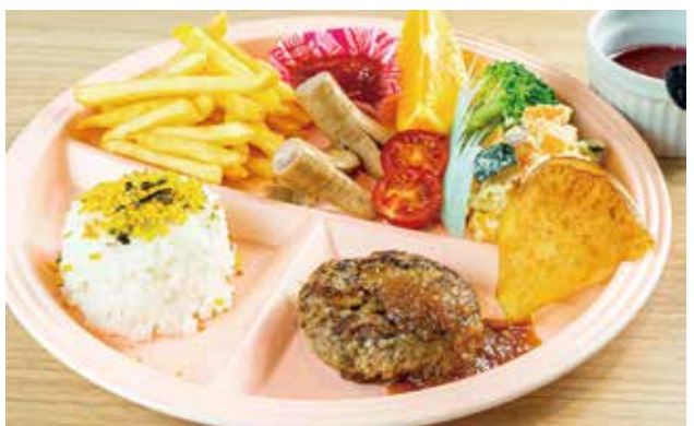
黒豚・黒牛ハンバーグ ドリンク付き (オレンジ・アップル)