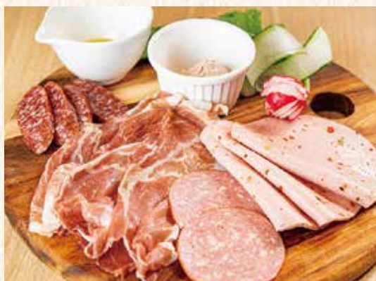
自家製黒豚ハム・ソーセージ 1,500円