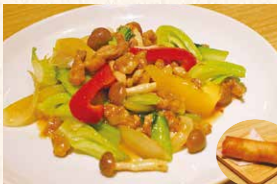
黒豚と季節野菜のクートン風ソテー