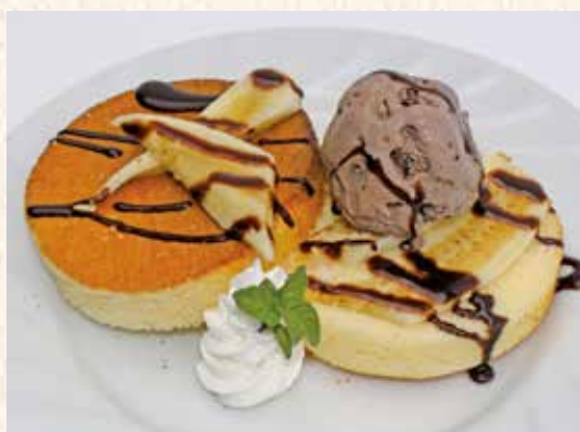
バナナショコラパンケーキ 550円